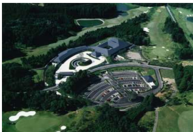
クラブハウス空撮

平成5年9月オープン。最寄の松尾横芝ICより0.8km、東京からでもわずか1時間あまりという好立地にあり、また各ホール間は自然林によって完全にセパレートされ、要所に池が配置された戦略型のゴルフコース。クラブハウスは地元“松尾城郭”の洋式城郭（陵堡式城郭）の流れを汲んでおり、日本建築の伝統手法を用いながら「四陵郭」の形態を踏襲している。クラブハウス内にはVIP用の特別室、また女性用パウダールームには個室タイプを設けるなど、充実の施設を兼ね備えている。